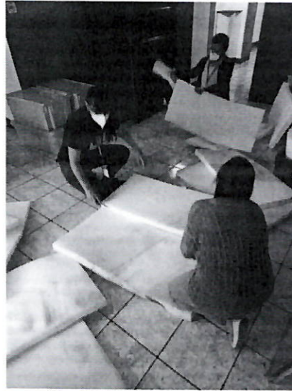
Imagen 7: validación de la metodología para talleres de sensibilización sobre patrimonio cultural intangible