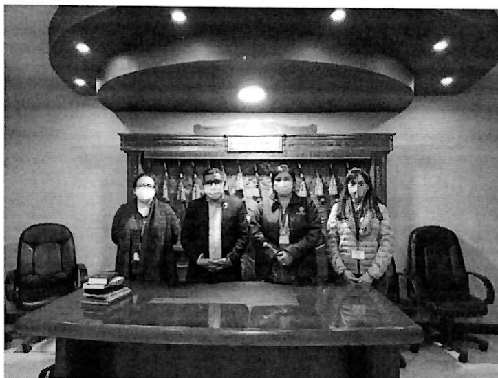
Imagen 2: reunión con alcalde Santiago